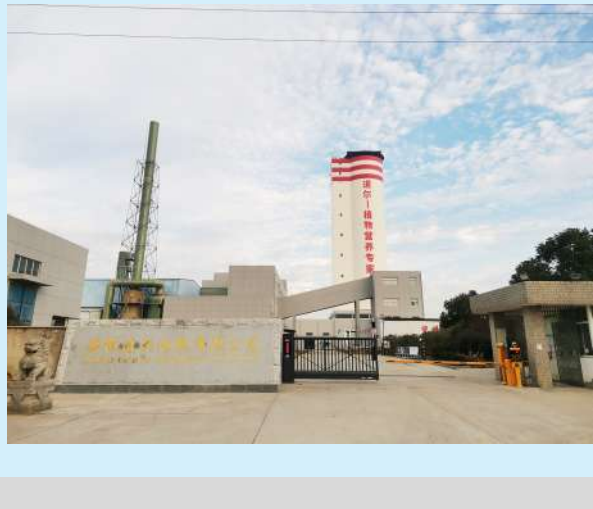
惠多利化肥储备仓库

未来,惠多利将深入推进自有工厂产品和自有营销网络高效融合,同时继续深化同产业链上下游合作伙伴的深度合作,扎实推进科工贸一体化发展。