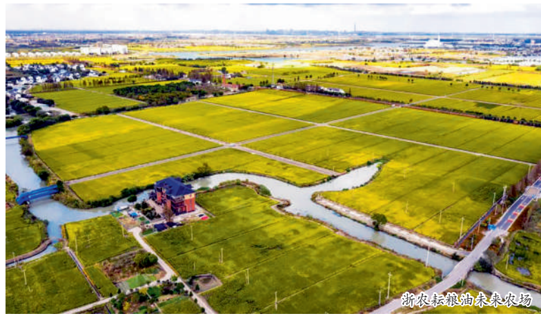
浙农农服的未来农场

浙农股份持续打造集成化服务新模式,积极推进现代农业社会化服务体系建设,介入耕地土壤治理领域,加快探索“全域土地整治+现代农业示范区建设+社会化服务”的“EPC+O”业务模式。2023年,先后中标兰溪、临海、椒江、岱山、永康等地项目,截至目前,公司已承接土壤改良及土地治理施工面积近7万亩。在此基础上,公司创新“土地整理+未来农场建设+农业社会化服务”的为农服务新路径,其中浙农股份运营的嘉善万亩水稻种植示范区核心区亩均产量达1530斤,较常规亩均增产约100斤左右,同时亩均减少灌水量30%,用肥用量减少15%,降低碳排放20%,实现节能减排、绿色低碳,已获得浙江省农业